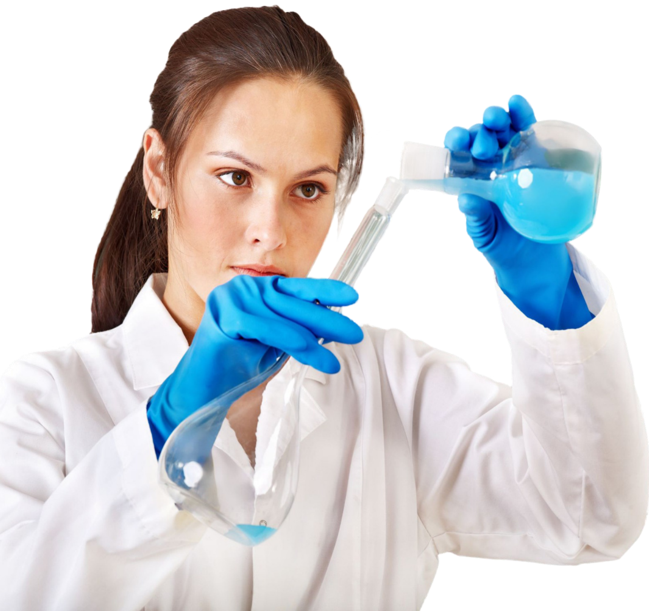
chemistry-lab-experiment